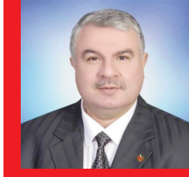
Zeynel Abidin Kıymaz

bilgi aldı. Bakan Uraloğlu, yapımı devam eden Balıkayağı Köprülü Kavşak Bulvarının bir kısmının tamamlanarak Ramazan Bayramından önce trafiğe açılacağını söyledi. Bakan Uraloğlu daha sonra Şanlıurfa Fuar merkezinde düzenlenen Devlet Teşvikleri Tanıtım günlerine katıldı. Bakan Uraloğlu ve beraberindekiler buradaki stantları gezerek bilgi aldı. Haber: GAP olay